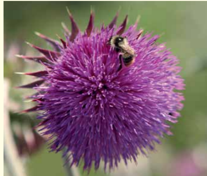
Abbildung 12: Nickende Distel ( Carduus nutans ) mit einer Arbeiterin der Bunten Hummel ( Bombus sylvarum ).

Ackerschläge lassen sich durch Ansaat mit ein- oder mehrjährigen Blühmischungen zu wertvollen Lebensräumen für die wildlebende Flora und Fauna entwickeln. Da auf den Flächen jedoch zu einem