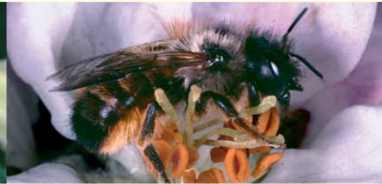
Abbildung 3: Die Rostrote Mauerbiene ( Osmia bicornis , Körperlänge 12 mm) gehört im zeitigen Frühjahr zu den Bestäubern von Obstbaumblüten.

Kulturlandschaft zumeist noch viel stärker betroffen als die Honigbiene. Wie diese sind sozial lebende Wildbienenarten, Hummeln und einige Furchenbienenarten mit einer Flugzeit vom Frühling bis in den Herbst hinein ebenfalls von einem ununterbrochenen Blütenangebot abhängig. Für Einsiedlerbienen (= Solitärbienen), welche nur eine begrenzte Flugzeit von teilweise wenigen Wochen haben, ist hingegen entscheidend, dass sie während dieser Phase ein ausgedehntes Nahrungsangebot vorfinden, zumeist in Form bestimmter – bei oligo- oder monolektischen Bienenarten weniger/ einzelner – Blütenpflanzenarten.