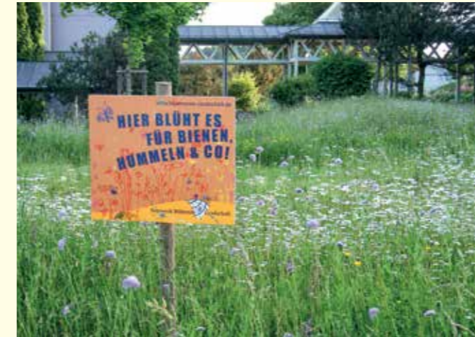
Abbildung 39: Blühende „Grünfläche“ um eine Schule in Wangen mit Informationstafel

zielführend für die Umsetzung tragfähiger Konzepte. Die Akzeptanz der Maßnahmen durch die Bewirtschafter, die letztendlich für deren Umsetzung und dauerhafte Erhaltung verantwortlich sind, steht hier im Vordergrund.