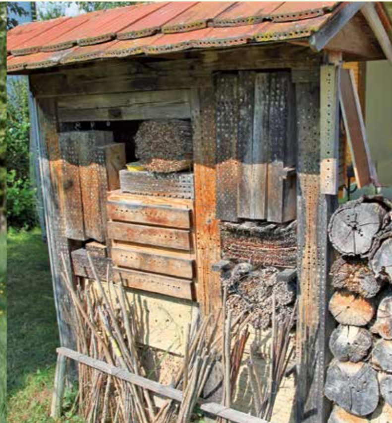
Abbildung 8: „Insektenhotel“ mit senkrecht gestellten markhaltigen Stängeln.

engem Raum leicht erreichbare Nahrung bzw. Wirte vorhanden sind. Ein Maschendraht, welcher um die Nisthilfen herum angebracht wird, beugt dem Bienenverlust durch Vögel vor (siehe Abbildung 9). Um den Parasitendruck zu vermindern, sollten nach 1 bis 2 Jahren neue Nisthilfen hinzugefügt oder an anderen Stellen in der Umgebung aufgestellt werden. Durch Aufstellen solcher