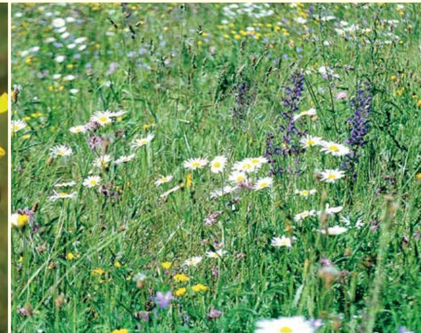
Abbildung 29: Durch die Beweidung von Streuobstwiesen können relativ blütenreiche Bestände erhalten werden.