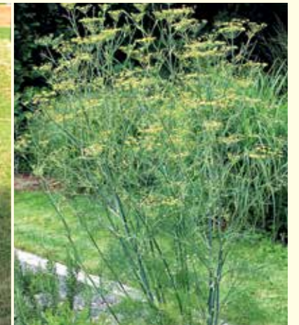
Abbildung 18: Mit Blüte- und Fruchtstand schmückt Fenchel (Foeniculum vulgare) das Duft- und Aromabeet.

Trachtlücken, die vor allem im zeitigen Frühjahr und im Spätsommer auftreten, entschärft werden. Beliebte Sommerblüher, die gerne von Bienen aufgesucht werden, sind Lavendel (Lavandula angustifolia), Katzenminze (Nepeta cataria) oder auch die Wiesenschafgarbe (Achillea millefolium), die sich für naturnahe Pflanzungen gut eignet. Im Frühjahr bzw. Frühsommer bereichern das Berg-Steinkraut (Alyssum montanum), Rosmarin (Rosmarinus officinalis) und der Echte Salbei (Salvia officinalis) das Pollen- und Nektarangebot. Davon profitieren auch Wildbienen wie z. B. die Garten-Hummel (Bombus hortorum). Eine beson-