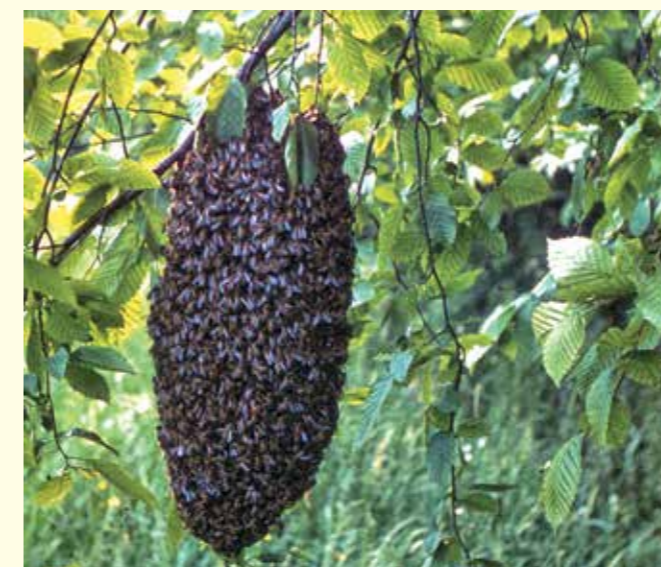
Abbildung 26: Bienenschwarm im Wald

zen Baden-Württembergs. Darüber hinaus zählen Ahorn, Linde und Eiche dazu. Diese Baumarten sollten daher an geeigneten Standorten und in der passenden Region nicht nur im Rahmen der naturnahen Waldwirtschaft, sondern auch als Nahrungsgrundlage für Bienen gefördert werden. Als wichtige Trachtquellen des Waldes sind außerdem Wildkirsche, Elsbeere, Eberesche, Faulbaum, Heidearten und spätblühende Heckenrosen (Pollen!) zu nennen. Waldbesitzer haben damit auch bei der Anlage von Forstkulturen Möglichkeiten, die Bienenweide im Wald zu verbessern.