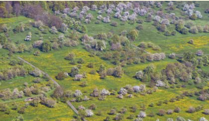
Abbildung 27: Die Kulturlandschaft Streuobst bietet Lebensraum für Insekten, Kleinsäuger sowie Sing- und Greifvögel.