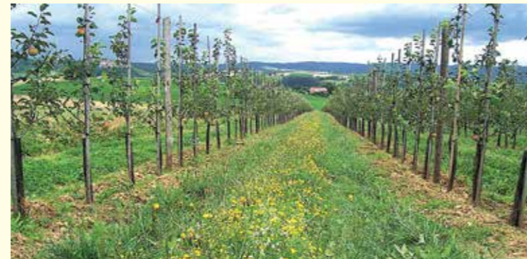
Abbildung 36 oben: Blühstreifen in der Fahrgasse einer Obstanlage Abbildung 37 unten: Holunder (Sambucus nigra) als Ankergehölz am Reihenanfang

Dabei sind im Obstbau bei der Anlage von Strukturen eine Vielzahl von pflanzenschutzfachlichen Fragen zu berücksichtigen (z.B. Zwischenwirts-pflanzen für Schaderreger, Veränderungen der Feld- und Wühlmauspopulationen). Daher ist die enge Verzahnung von Öko-Obstbauberatern und Naturschutzfachleuten notwendig und