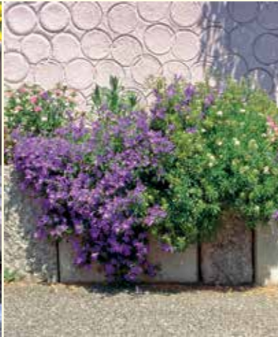
Abbildung 21: Die Polster-Glockenblume (Campanula poscharskyana) eignet sich besonders für Steingärten oder Blumenkästen.