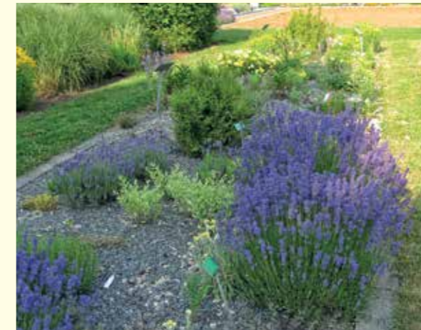
Abbildung 17: Bienenweide, Gewürz und Schmuck bis zum ersten Frost: Blühender Lavendel (Lavandula angustifolia) im Duft- und Aromabeet.

Trockene, sonnige Ecken im Garten bieten sich für die Anlage eines Duft- und Aromabeetes an (Abbildung 17 und Abbildung 18). Die Vielfalt an Düften und Aromen der „Duftpflanzen“ dienen dem eigenen Wohlbefinden und helfen den Bienen. Wird der Blühtermin der Arten bei der Auswahl berücksichtigt, können