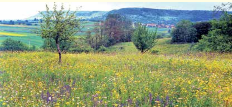
Abbildung 35: Ein Ackerrandstreifen auf der Gemarkung Heilbronn. Bunt blühende heimische Wildkräuterbestände stellen die Nahrungsgrundlage für zahlreiche Bienenarten (hier 29 Arten) dar.

Abbildung 34 unten: Neupflanzung von Obstbäumen - eine Investition für die Zukunft.