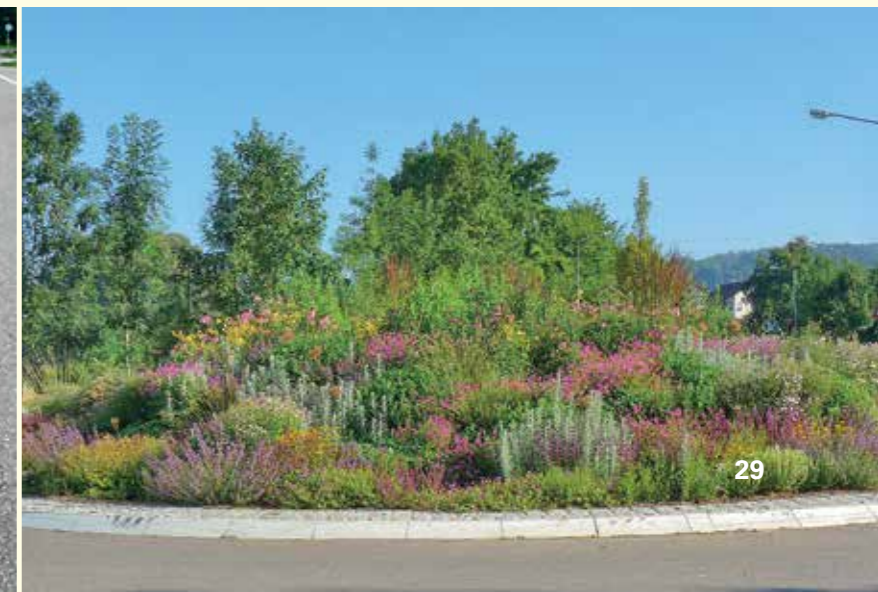
Abbildung 24: Staudenpflanzung in Donzdorf

Solche Veränderungen des Pflegeregimes erfordern in vielen Kommunen strukturelle Anpassungen mit langfristigen Umsetzungsperspektiven. Auch müssen diese Veränderungen keine völlige Abkehr von der herkömmlichen Arbeitsweise, etwa von saisonalen Schmuckbeeten bedeuten, denn viele Bürger werden dies weiterhin fordern. Ebenso gilt, dass naturnahe insektenfreundliche Pflanzungen und Pflegekonzepte nicht überall die beste und effizienteste Lösung darstellen. Doch gibt es in jeder Kommune Potentiale für ein ökologisches Umdenken im Grünflächenmanagement. Ausdauerndes Erklären und Werben für die ökologische Neuausrichtung der Pflege bei Mitarbeitern und in der Öffentlichkeit ist deshalb eine Grundlage für den langfristigen Erfolg.