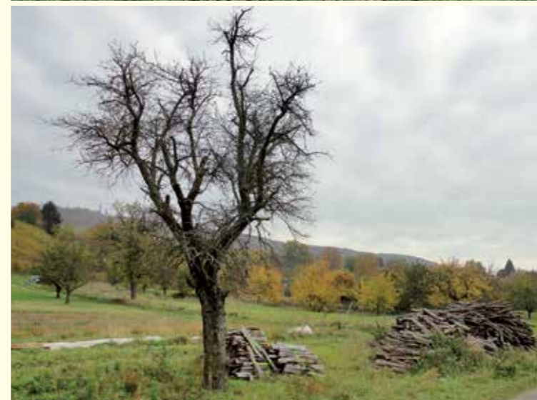
Abbildung 6 oben: Stehende abgestorbene Baumstünke stellen natürliche Nisthabitate für totholzbewohnende Wildbienen dar, etwa für die Blauschwarze Holzbiene.