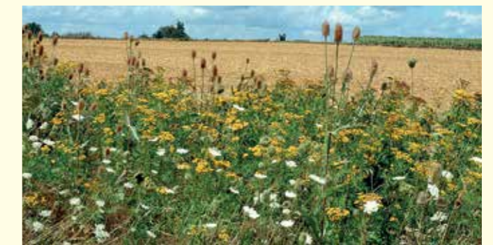
Abbildung 14: Neuanlage eines Saumbiotops im zweiten Jahr nach einer Wildkräuteraussaat auf Ackerland.

Nach dem Auflaufen der Saat konkurrieren die Keimlinge der Ansaat mit den spontan keimenden Arten aus dem vorhandenen Samenpotential des Bodens. Aus diesem entwickeln sich häufig konkurrenzstarke einjährige Ackerwildkräuter wie Melden oder Klettenlabkraut, die den Arten der Ansaat das Licht zur Keimling-