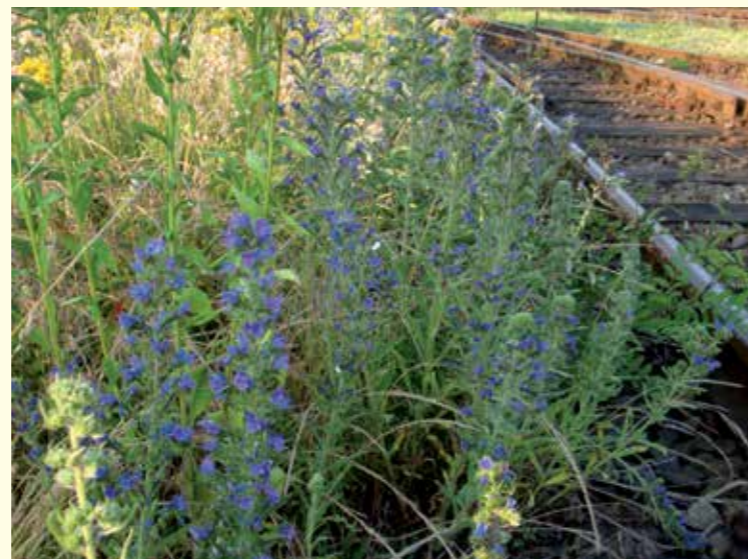
Abbildung 1 oben: Männchen der 1 cm großen Spargel-Sandbiene ( Andrena chrysope ) auf einer Blüte von wildwachsendem Spargel ( Asparagus officinalis ). Dieser blüht in Übereinstimmung mit der genetisch fixierten Flugzeit der Spargelbiene und nicht wie der Kulturspargel vier Wochen später.