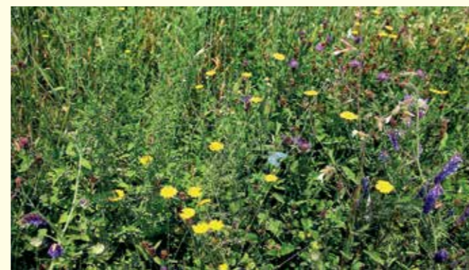
Abbildung 13: Färber-Kamille (Anthemis tinctoria), Vogel-Wicke (Vicia cracca) und Flockenblume (Centaurea jacea) am Rand eines Getreideackers.

Acker-Randstreifen bzw. von Acker-Lichtstreifen ohne größeren zusätzlichen Aufwand zu bewerkstelligen (siehe auch http://baden-wuerttemberg.nabu.de/themen/landwirtschaft/kultur-natur/ ). Der Bewirtschafter muss jedoch darauf achten, dass in Systemen von Kulturpflanzen mit eingesäten Insektentrachtpflanzen während deren Blühphase keine bienengefährlichen Pflanzenschutzmittel auf die Streifen verdriftet werden. Abbildung 13 zeigt einen blühenden Ackerrandstreifen auf einem ökologisch wirtschaftenden Betrieb. Im Übrigen sind Spritz- und Bodenbearbeitungsmaßnahmen an Ackersäumen zum Weg hin zu unterlassen. Auch diese Bereiche stellen Rückzugsräume für Flora und Fauna dar.