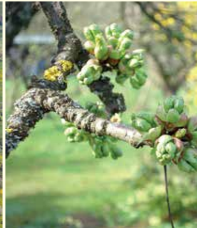
Abbildung 28: Durch geschickte Sorten- und Artenwahl kann sich die Blüte von Streuobstbeständen über nahezu zwei Monate erstrecken.