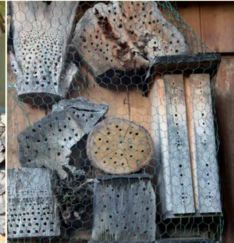
Abbildung 9: Ein Maschendraht vor dem Bienenhotel schützt vor Vogelfraß.

Etwa drei Viertel der heimischen Wildbienenarten nisten in selbstgegrabenen Gängen im Boden. Für diese Arten können ebenfalls zusätzliche Nistgelegenheiten beispielsweise in Form von künstlichen Steilwänden bereitgestellt werden. Entscheidend ist hierbei, dass das verwendete Bodensubstrat leicht grabbar ist und dennoch die Brutröhren stabil genug sind. Deshalb sollten etwa sandiger Löss und keine schweren Tonböden als Bodensubstrat Verwendung finden. Dieses Substrat kann z.B. in möglichst tiefe (> 20 cm) Blumenkästen oder Holzkästen eingefüllt werden. Übereinander