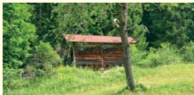
Abbildung 25: Bienenhaus am Waldrand

Mit einer Besonderheit unterscheidet sich die Imkerei ganz wesentlich von den anderen Bereichen der Landwirtschaft: In der Regel werden keine eigenen Anbauflächen benötigt. Trotzdem, oder gerade deshalb, sind Imker gefordert, wenn es um die Verbesserung des Nahrungsangebots für Insekten geht. Beispielsweise indem sie