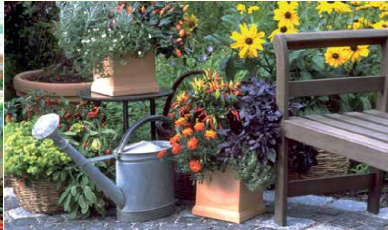
Abbildung 20: Kräuter in Kombination mit Blumen sind eine Augenweide. Hiervon werden auch die Honigbiene und einige weit verbreitete Wildbienenarten angezogen.