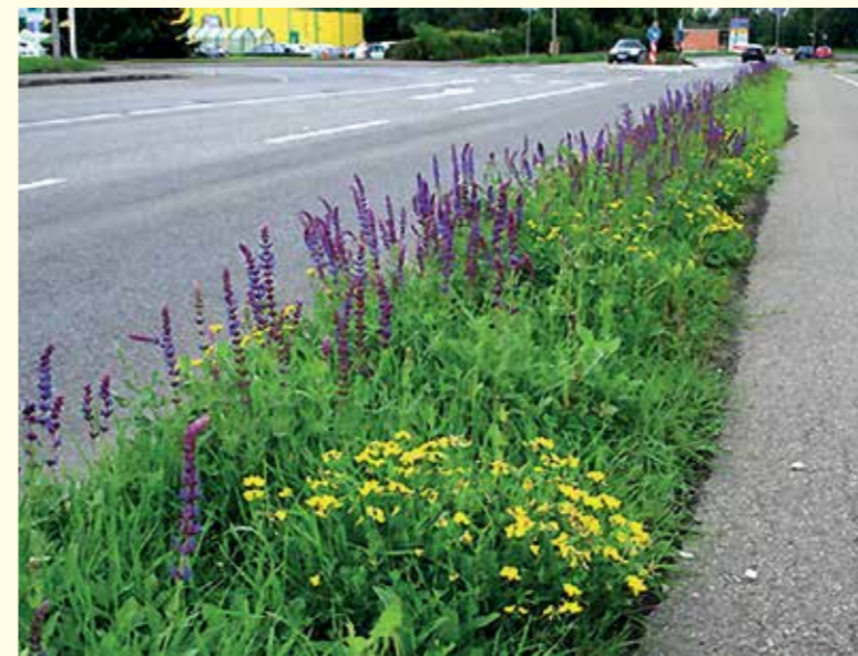
Abbildung 23: Eine einfache blühende Ansaat aus zwei Pflanzenarten, hier Salbei und Hornklee, sorgt für ausdauerndes Blütenflor mit geringem Pflegeaufwand an einem Straßenrand in Mössingen.

munen stellen sollten, sind „Warum mäht man so oft?“ und „Ist dies zwingend überall nötig?“. Oftmals reichen diese Fragen aus, um einen Denkanstoß und neue Planungsprozesse auszulösen. Ziel dieses Neudenkens ist es, insektenfreundlichere Pflegeregime Stück für Stück im Flächenmanagement der Kommune zu verankern. Große/radikale Veränderungen sind auch möglich, bedürfen jedoch längerer Vorbereitung mit breiter öffentlicher Diskussion und enger Einbeziehung der Entscheidungsträger sowie der Mitarbeiter und Bürger.