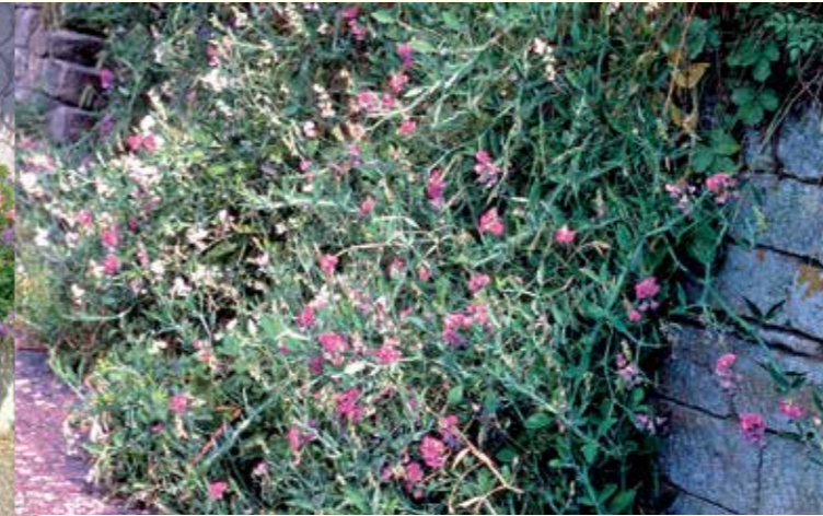
Abbildung 22: Die Breitblättrige Platterbse (Lathyrus latifolius), welche sich auch hervorragend als Sichtschutz an Zäunen oder Mauern bewährt, blüht fast den gesamten Sommer lang.

dere Augenweide sind mehrjährige Rosmarin- und Salbeibüsche, die für ein blaues Blütenmeer in den Frühlingsmonaten sorgen. Moderate Fröste, vor allem in Kombination mit Schnee, werden von ihnen gut vertragen, in höheren Lagen ist jedoch ein Frostschutz unabdingbar. In Tabelle 4 (siehe Seite 24) ist ein Beispiel für ein Duft- und Aromabeet in Form eines sogenannten „Aspektkalenders“ aufgeführt.