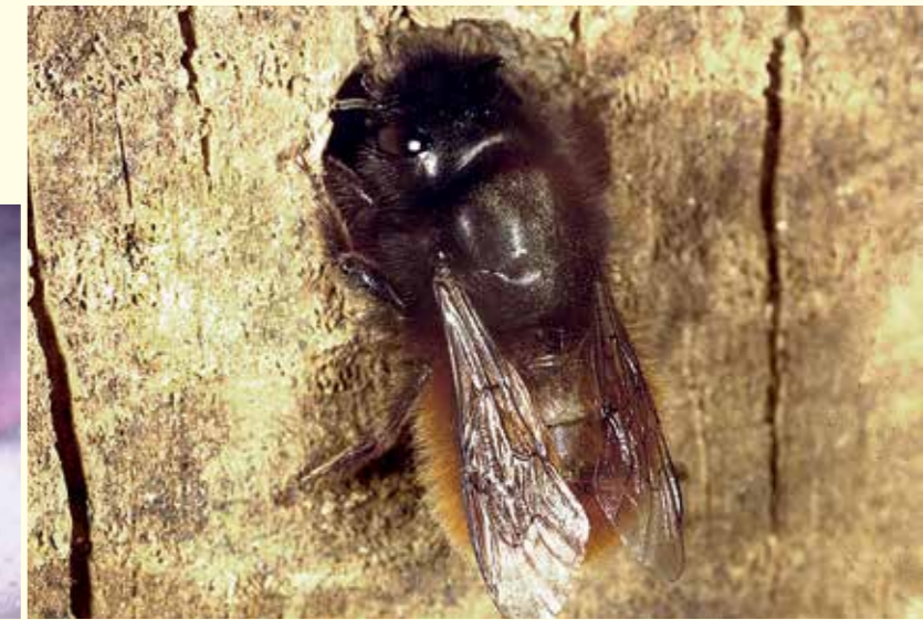
Abbildung 4 oben: Die Rotklee-Sandbiene ( Andrena labialis , Körperlänge 12 mm) am Eingang ihres Bodennests.