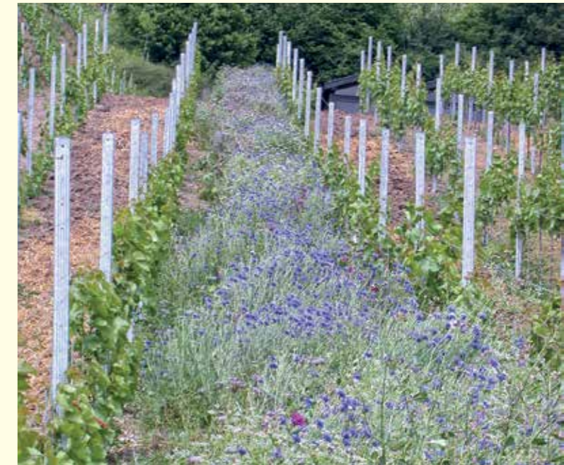
Abbildung 16: Artenreiche Blümmischung im Weinberg

Vor diesem Hintergrund ist das Belassen bereits bestehenden extensiven Grünlands die beste und kostengünstigste Methode.