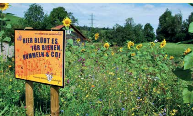
Abbildung 11: Imagegewinn für die Landwirtschaft durch Kommunikation

Im Zusammenhang mit der Erforschung nachwachsender Rohstoffe und mit Blick auf die Flächenproduktivität sowie einer Ökologisierung des Anbaus wird jedoch wieder intensiver an diesem Thema gearbeitet.