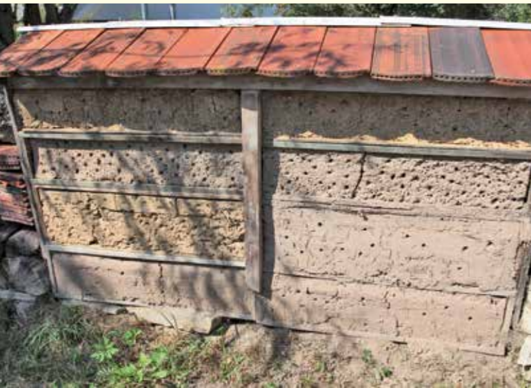
Abbildung 10: Künstliche Steilwand aus Lehm als Nisthilfe.

Im Gegensatz zu Wild- und Honigbienen sind andere Insekten in der Regel nicht ausschließlich auf Blütenprodukte als einzige Nahrungsquelle angewiesen. Außer an Blüten saugen z.B. Schmetterlinge auch an feuchter Erde, Baumsäften, Früchten, Kot, Aas oder auch Schweiß. Deshalb decken die hohen Ansprüche der Bienen an