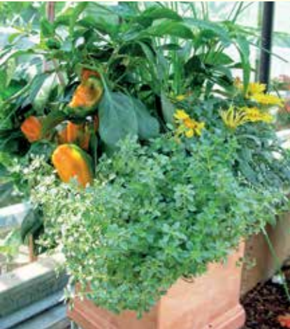
Abbildung 19: Mit Kräutern, Blumen und Balkongemüse lassen sich wunderschöne Gefäße für Auge und Gaumen gestalten. Auch für die Honigbiene stellt dieses Blütenangebot eine Bereicherung dar.